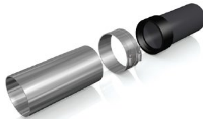
Dichtung auf ein Spitzende ziehen und Scherband überschieben.