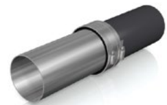
Schlösser wechselseitig anziehen.