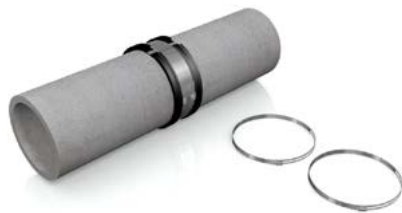
Scherband wechselseitig anziehen.