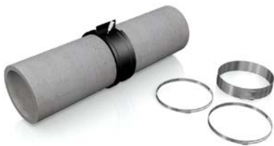
Das Gummiprofil verkleben.