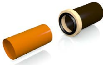
Rollring vor die Muffe halten.