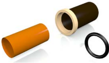
Kein Gleitmittel verwenden.