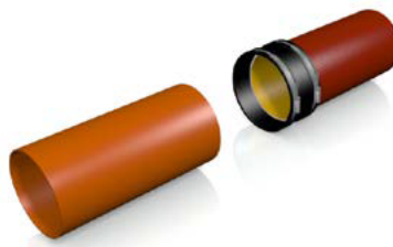
Kupplung über ein Spitzende schieben.