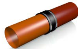
Kupplung mittig über beide Spitzenden schieben und Schösser wechselseitig anziehen.